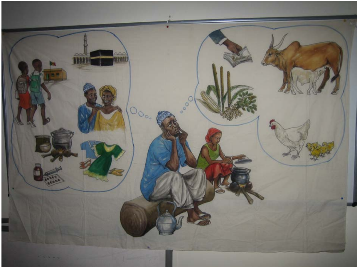
(le budget au cœur de la famille...)

C'est à partir de cette image sur le budget familial que les participants ont ressorti eux-mêmes les notions élémentaires du budget :